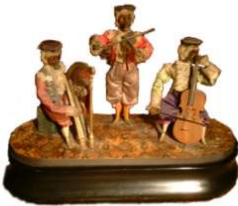
1870年頃 フランス 当館所蔵