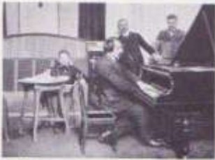
— Alfred Cortot —

http://www.orgel-horie.or.jp/ Email info@orgel-horie.or.jp