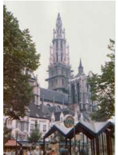
ベルギー アントワープ ノートルダム大聖堂 ベルギー最高 123mの鐘楼

これら教会の塔上や鐘楼に付けられたカリヨンは今も正確な時を告げ、例えばベルギーブルージュの鐘楼のカリヨンは15分ごとに美しい音色を響かせ、定期的にかリヨンコンサートも行われています。