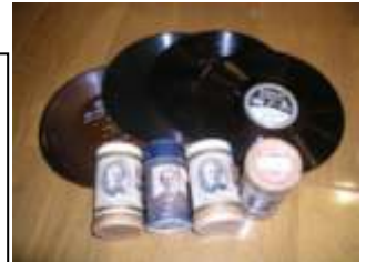
蠟管とレコード 当館所蔵

音楽再生装置としてその地位を確立していたオルゴールも、蓄音機の発明によって衰退していきます。歌も聴ける蓄音機の人気に押され、1920年にはオルゴールメーカーは市場から撤退します。工場は次々に閉鎖されオルゴール職人達は職を失いました。20世紀初頭はオルゴールから蓄音機へと移行する大きな転換期だったのです。