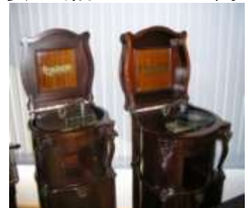
レニテフォン 1904年～1910年 1台でレコードもオルゴールも楽しめます。当館所蔵

参考文献: AFP通信2008年3月28日付 :「蓄音機の歴史」梅田晴夫 1976年 PARCO出版局 :日本大百科全書「蓄音機」小学館