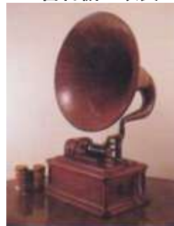
エジソン型蠟管蓄音機