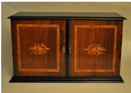
扉を閉めた状態のビュッフェ・シリンダー 食器棚のようにも見えます

1 つ目の特徴は、シリンダーや歯輪が直立しているアップライト型の機構です。内部の構造が直立しているため、演奏するオルゴールを正面から見る事ができ、また扉は左右にオープンする両開きの形態を持っています。左図のように、扉を閉めた状態が食器棚に似ていることから、このようなシリンダー・オルゴールはビュッフェ(食器棚)と呼ばれます。一般的なオルゴールの場合、上から覗き込まなければ内部の動きを見ることは出来ませんが、ビュッフェ・シリンダーであれば、人々は椅子に腰掛けた状態でオルゴールの動きと演奏を同時に楽しむことができます。