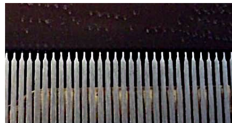
一般的な歯輪 先があるコームが並んでいます

2 つ目の特徴は、歯輪(コーム)にあります。一般的なシリンダー・オルゴールは、低音部から高音部まで全ての歯輪がピンを弾くように作られていますが、2 コーム同音式の歯輪は、2 本のコームが同音でペアになっており、そのうち 1 本の歯輪には先がない、つまりピンを弾くことができないようになっています。先がある方の歯輪がピンを弾いて音を奏でると、もう 1 本の歯輪と共鳴し、独特の響きが生まれるのです。シリンダー・オルゴールの全盛期には、このような細やかな工夫によって、様々な会社が自社のオルゴールに特別な個性を持たせようとしのぎを削りました。